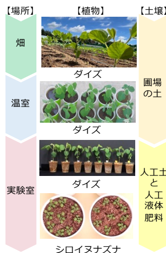
図 2. 畑と実験室、モデル作物とモデル実験植物を組み合わせた、畑の干ばつストレス応答機構の解明に向けた取り組み

高さ 30 cm の畝を用いることにより、畝区では土壌水分が通常区よりも減少し、ダイズの生育や収量が顕著に低下します。左図は、播種後 56 日目のダイズの生育状況を示しています。試験区に設置した土壌水分センサーの情報は、黒いケーブルを通して白い箱の中にある記録装置に蓄積されており、試験区内の土壌水分の経時的なモニタリングを行っています。右図は、それぞれの試験区で育った収穫時のダイズの様子と収穫したダイズ種子を示しています。この場合でもダイズの収量は、およそ半分程度になっています。しおれが見られない程度の「見えない干ばつ」においても、作物生産に大きなダメージを与えていることがわかります。実験場所は、茨城県つくば市です。