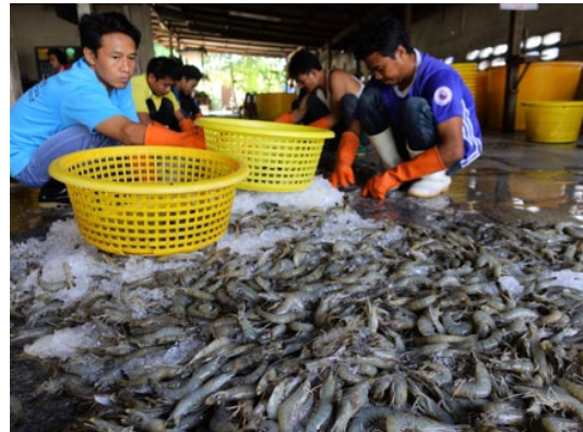
図2 実験により収穫されたウシエビと仲買所での仕分け作業