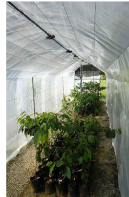
図1 苗畑観測システム

インターバル撮影が可能なデジタルカメラと気象測器を用いて、葉の生産のタイミングと気象データを取得する観測システムを開発。雨量の変化を排除するため、観測システムは透明なプラスチックシートで覆われている。