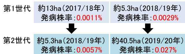
図3 健全種茎増殖実証試験の結果