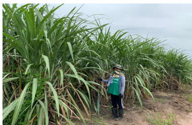
図2 健全種茎増殖実証試験 1次圃場の様子