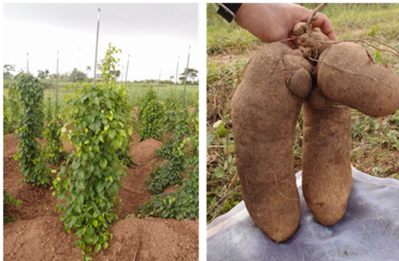
図1 西アフリカにおけるヤムの栽培（左）と収穫したイモ（右）