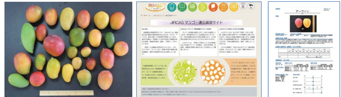
図 2 国際農研が保有するマンゴー遺伝資源(左)、「JIRCAS マンゴー遺伝資源サイト」トップページ(中央)および品種特性情報ページ(右)