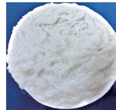
図 1 液状化した発酵型米麺