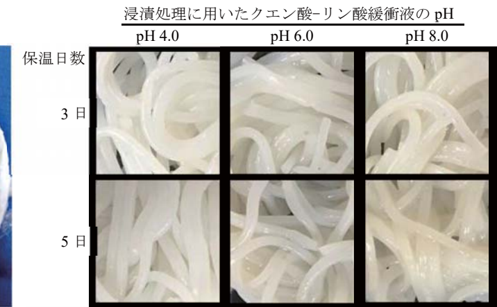
図 2 緩衝液 (pH 4.0, 6.0, 8.0) による浸漬処理を施した発酵型米麺を 37℃で 3, 5 日間保温した時の形状変化