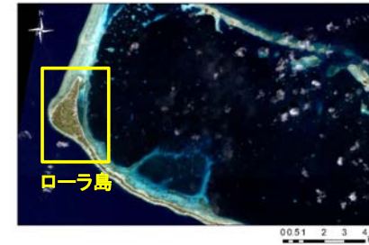
図 1 マーシャル諸島共和国マジュロ環礁ローラ島