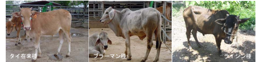
写真1 メタン排出量測定を実施した牛品種