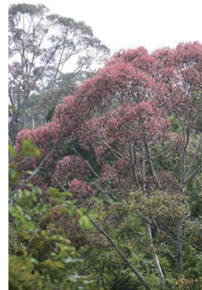
図 1 S. curtisii の結実の様子（セマンコック森林保護区にて 2014 年 7 月撮影）