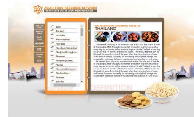
図4 タイの伝統発酵食品データベースホームページ画面