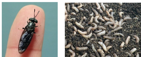
図 1 アメリカミズアブ成虫(上左)と幼虫(上右)、および産卵用容器(下、塩化ビニル製)