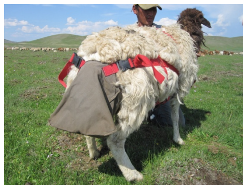
図 2 糞袋を装着したヒツジ