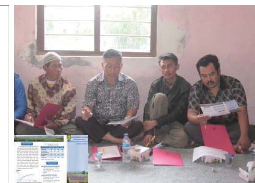
図 3 現地語で作成した技術解説リーフレット（左下）を読む農家説明会参加者

堆肥 10t/ha 施用、標準耕起、3 反復の平均値、エラーバーは標準誤差。キャベツ及びトマトは 2011 年雨期作、サヤインゲンは 2012 年雨期作、トウモロコシは 2012 年乾期作。