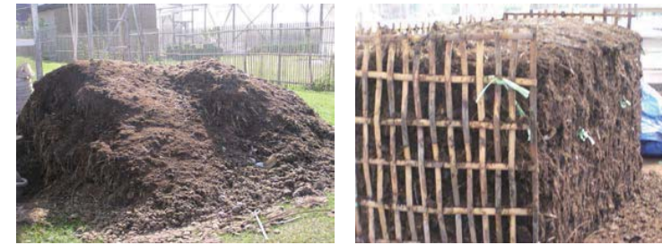
図 1 馬糞堆肥の製造過程

馬糞（写真左）を竹製の枠内に堆積して発酵させる（写真右）。