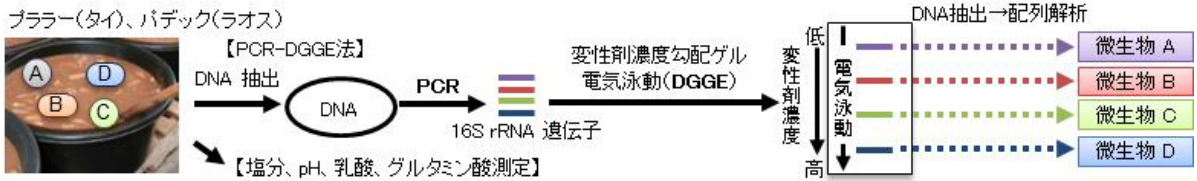
図1 遺伝子配列に基づく網羅的微生物同定 (PCR-DGGE 法) と呈味成分分析の概要