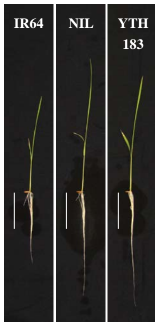
図1 qRL6.4-YP5 を有する NIL および YTH183 の幼植物の表現型 5 \mu M の NH 4 Cl を与え、水耕法で 8 日間栽培。バーは 50 mm を示す。