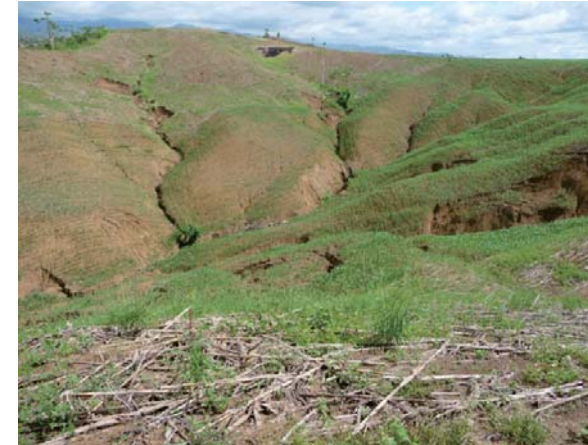
写真1 ルソン島におけるガリー侵食発生状況 (2010年11月23日撮影)