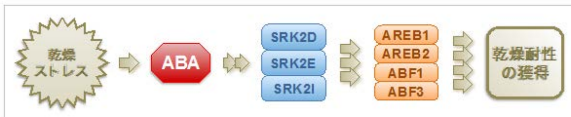
図2 植物の乾燥ストレス応答機構の模式図 4種類のAREB/ABF型転写因子が3種類のSnRK2タンパク質リン酸化酵素の下流で乾燥ストレス耐性を制御する。スペースの都合により、SnRK2については、1種類の名称のみ表記した。