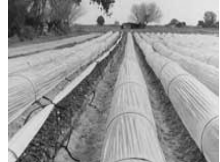
Túneles o Microtúneles

Son más fáciles y baratos de construir que los invernaderos y resultan móviles. Sin embargo, no ofrecen tanta protección frente a las bajas temperaturas.