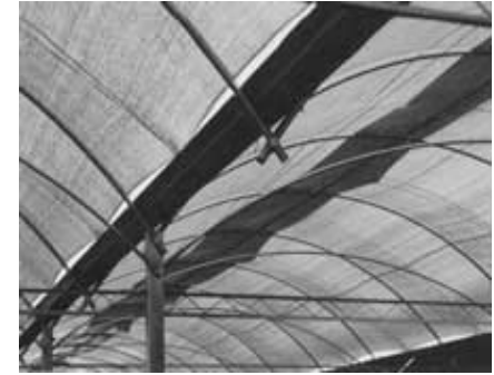
Mallas para media sombra