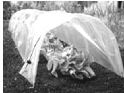
Túnel o Microtúnel