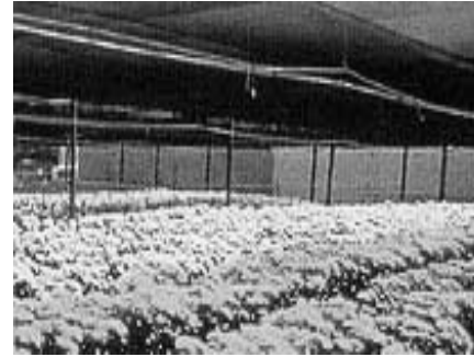
Malla para media sombra