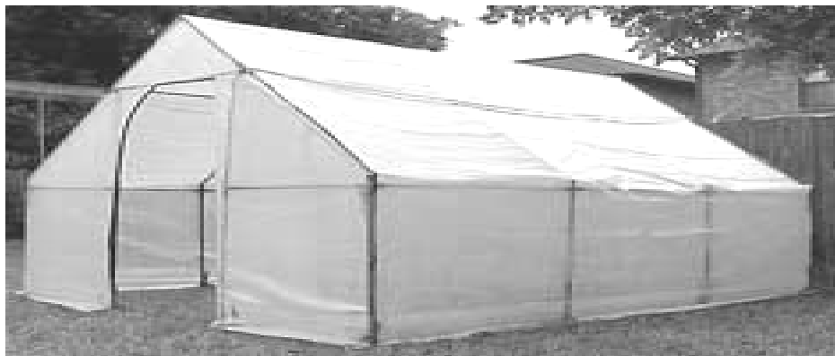
Láminas de polietileno transparente usado como cobertura

Plásticos de mayor espesor, 200 micrones, son para el techo y las paredes del invernadero.