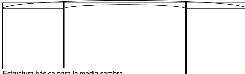
Estructura básica para la media sombra

La altura, del piso hasta la malla, debe ser de 2 a 2,20 metros, espacio suficiente para que los agricultores puedan moverse debajo del mismo.