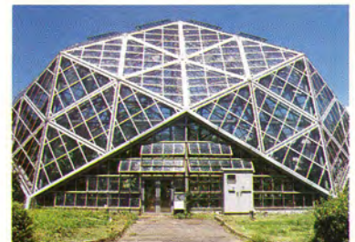
旧熱帯農業研究センター円形温室