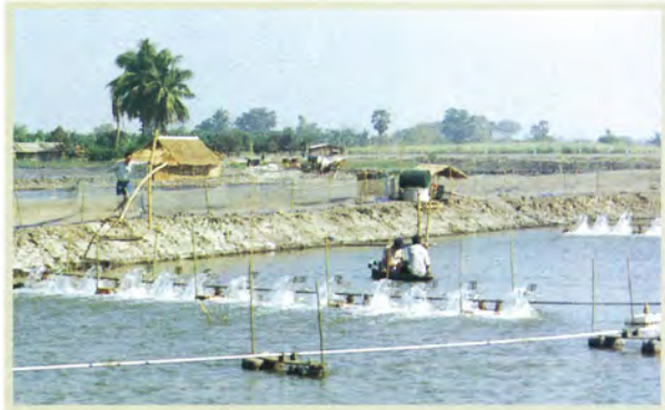
ウシエビ養殖プロジェクト（タイ）