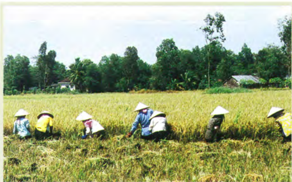
メコンデルタファーミングシステム（ベトナム）