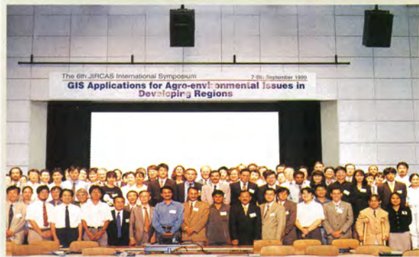
JIRCAS シンポジウム (1999)