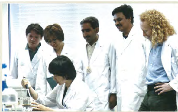
招へい共同研究 (本所)