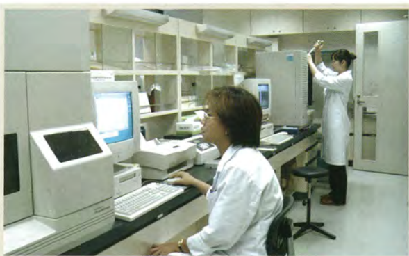
同上 (遺伝子の塩基配列の解析)