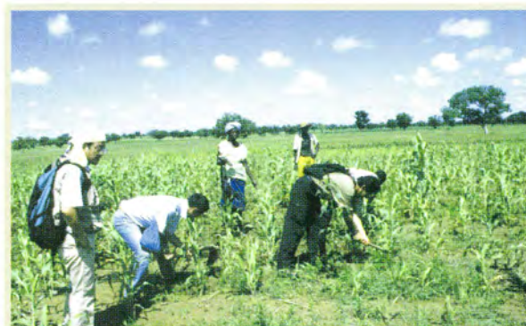
砂漠化プロジェクト（ブルキナファソ）