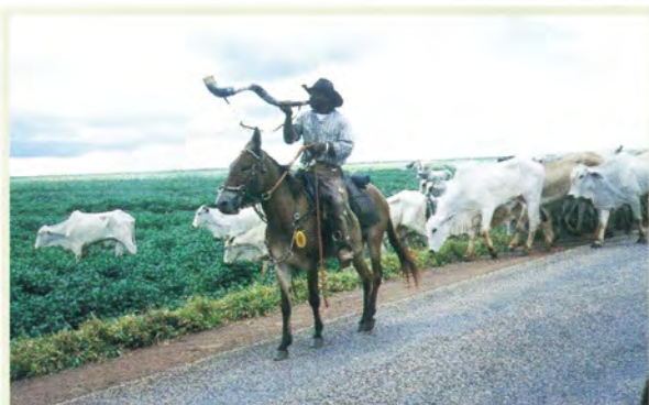
農牧輪換プロジェクト（ブラジル）