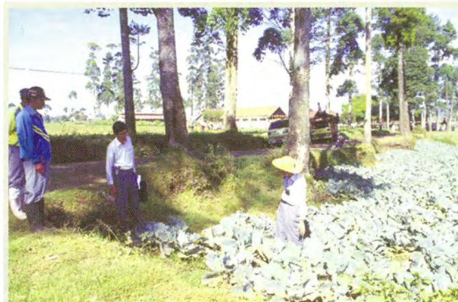
地域農業プロジェクト（インドネシア）