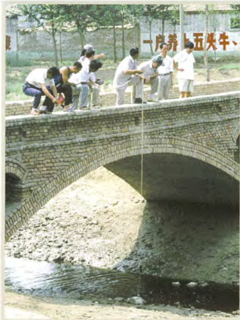
中国食料プロジェクト（中国）