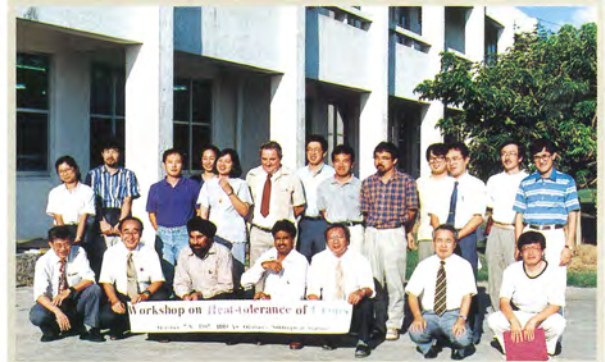
耐暑性ワークショップ (1997)