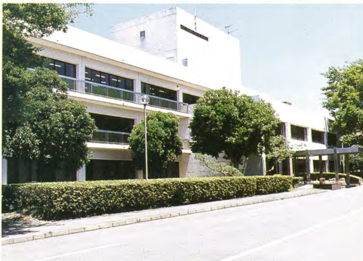
旧熱帯農業研究センター (現農業生物資源研究所)