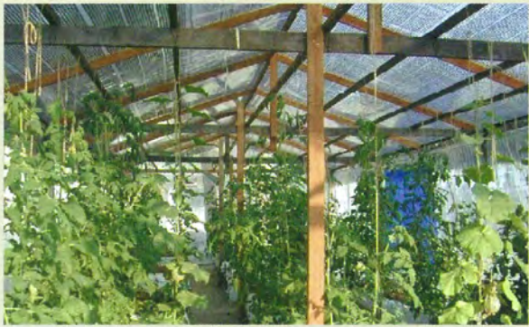
養液栽培装置の現地実証（タイ）