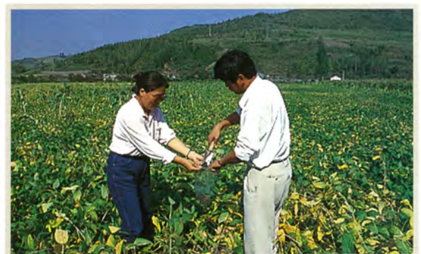
中国食料プロジェクト（中国）