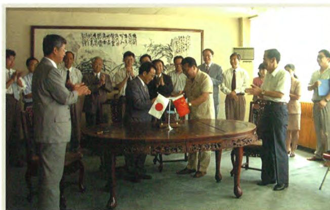
中国総合プロジェクト合同調印式 (1997)