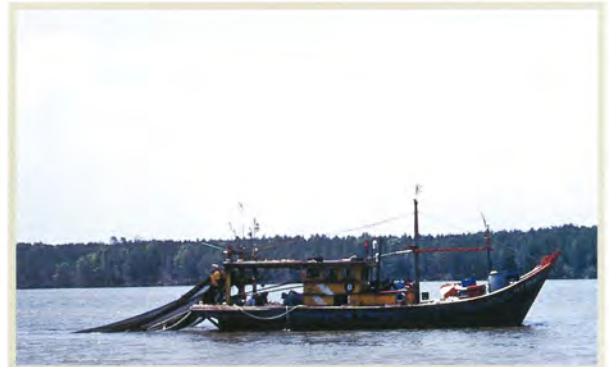
マングローブ汽水域プロジェクト（マレーシア）