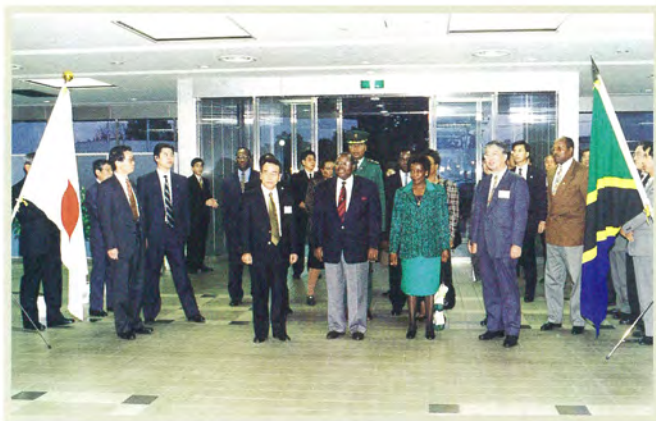
タンザニア大統領来所 (1998)