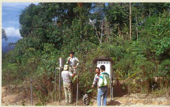
在来有用樹プロジェクト（マレーシア）