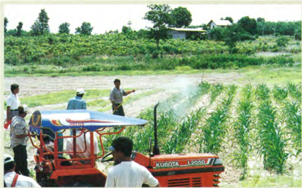
東北タイプロジェクト（タイ）