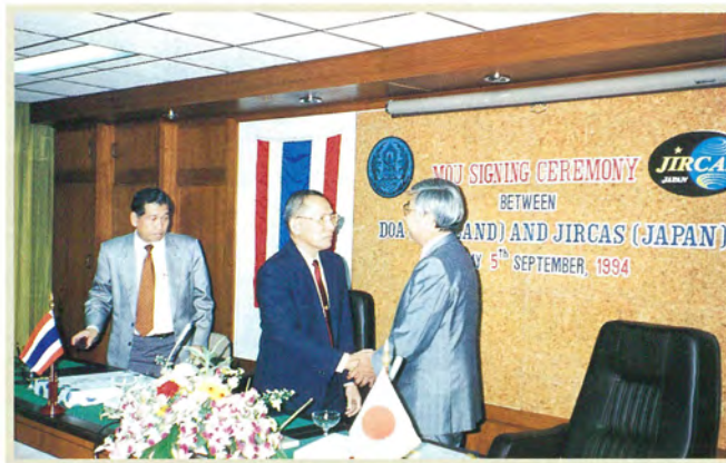
タイ農業局との MOU 調印式 (1994)