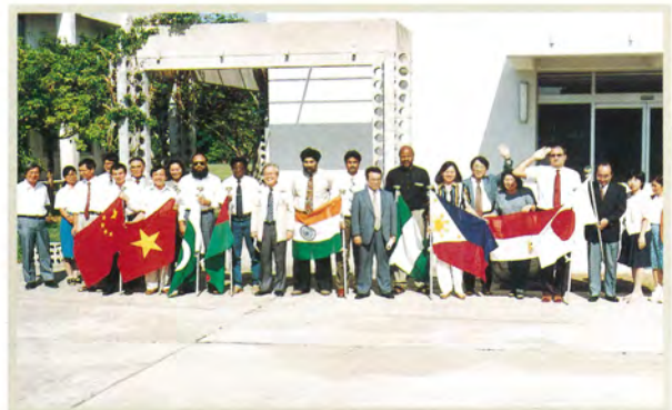
招へい共同研究 (沖縄支所)