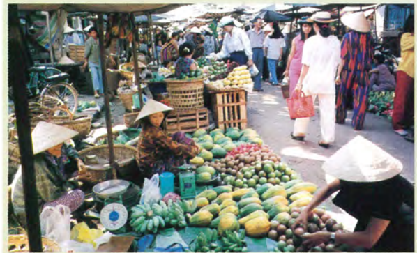
熱帯アジアのマーケット調査（ベトナム）