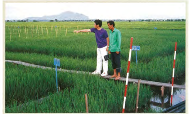
TARC の試験圃場（マレーシア）