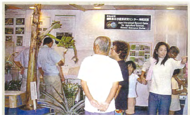
八重山産業祭での公開 (沖縄支所)