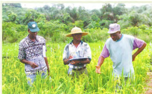
西アフリカ稲作プロジェクト（コートジボアール）