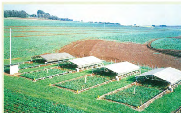
広域南米大豆プロジェクト（ブラジル）