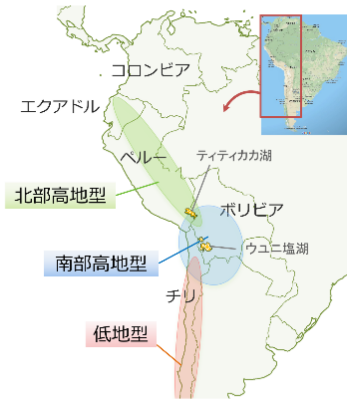
図 2. キヌアの北部高地型、南部高地型および低地型の主な栽培地域