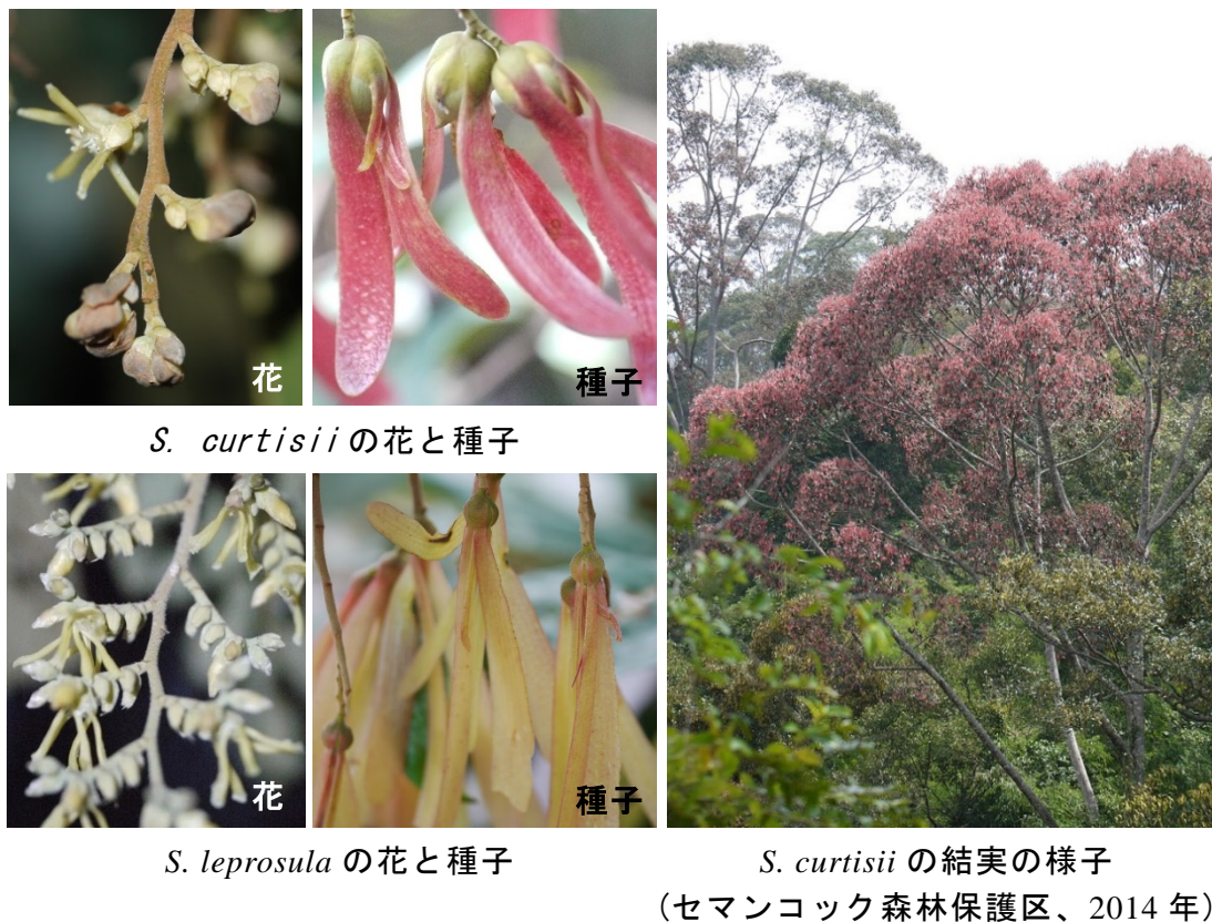
図 1. フタバガキ科樹種の開花結実

リゲン)の存在が指摘されてきましたが、1999年にFT (Flowering locus T) 遺伝子がシロイヌナズナで発見され、花芽形成に重要なタンパク質が存在することが明らかになりました。シロイヌナズナでは日長によって発現するCO (CONSTANS) 遺伝子によってFT 遺伝子やLFY 遺伝子等の発現が誘導され、開花に至ります。本研究ではフタバガキのFT と LFY の発現を調べました。