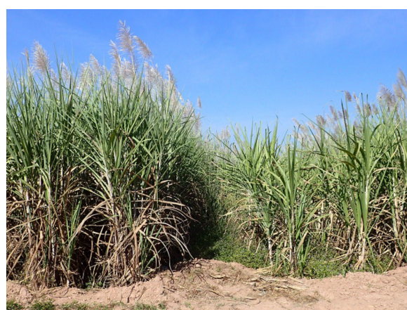
図1 東北タイのコサムピサイにおける株出し2回目の収穫時写真。左:「TPJ04-768」、右:普及品種「KK3」。(2014年12月撮影)