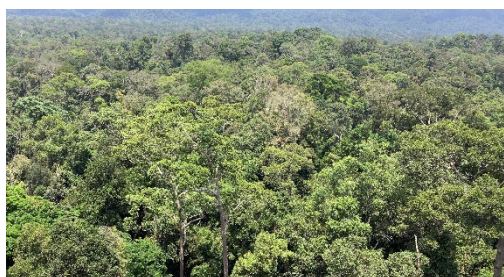
図1 マレーシア低地フタバガキ科熱帯雨林

マレーシアにおけるフタバガキ科林業樹種の最低伐採サイズは直径50cmと定められているが、この基準で択伐された後の二次林において、健全な種子生産が行われるかは未知であった。そこでフタバガキ科4樹種について、シミュレーションにより択伐後の母樹に到達する他家花粉の割合を推定する方法を開発し、既存の択伐基準で健全な種子生産が可能かどうか検証した。早生樹種では現行択伐基準(直径50cm)で伐採しても約3割から8割の他家受粉が維持されるのに対し、非早生樹種では他家受粉は2割以下に減少する(図2、表1)。よって、非早生樹種については直径50cmより大きい木も残す厳しい択伐基準の必要性が示唆された(表1)。