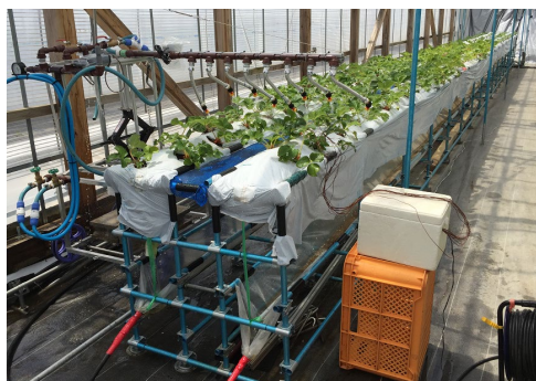
図1 温湯散布装置 (岩手県陸前高田市)