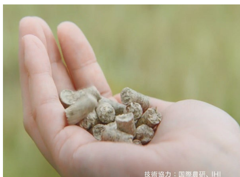
技術協力：国際農研、IHI

世界で多く消費されているパームオイルの製造過程で排出される多様で膨大な未利用バイオマスの利用促進を狙い、同一プロセスで、パーム幹、葉、ヤシ殻、繊維すべてをエネルギーやマテリアルに変換する製造技術を開発した(図2)。このプロセスは「原料マルチ化プロセス」と言い、マレーシア・ジョホール州のパイロットプラントで、実規模レベルで実証された(図3)。この「原料マルチ化プロセス」により、これまでパームオイル産業から排出される膨大なバイオマスに対して経済合理的で環境負荷低減を担保した再資源化が可能となった。現在、同国サラワク州のパーム搾油工場の協力を得て、「原料マルチ化プロセス」を導入し、パーム幹とヤシ殻から持続可能な燃料用ペレットや家具材ペレット製造のための調達試験を開始している。