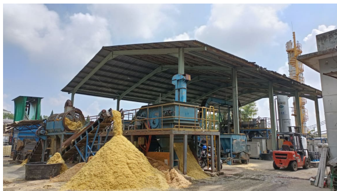
図3 マレーシアジョホール州クルアンにある実証設備。廃液などは糖質回収、バイオガス製造、液肥化を行い、多種多様(カスケード)な利用を行うゼロエミ型プロセスである。