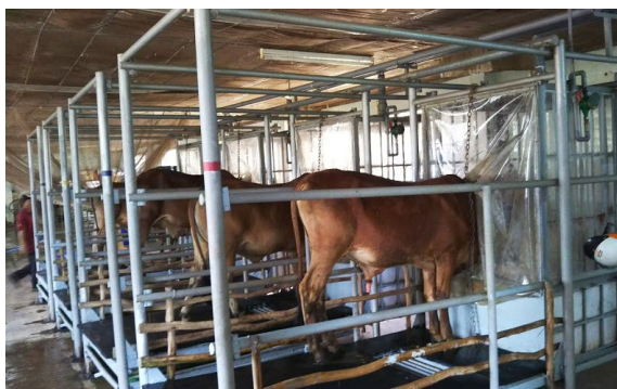
図1 ベトナム在来牛(ライシン牛)とメタン排出量測定の様子

ライシン牛は熱帯地域で広く飼養されるゼブー牛( Bos indicus )の一種であることから、本技術は他の地域においても、ゼブー牛を対象に広く活用できる可能性がある。