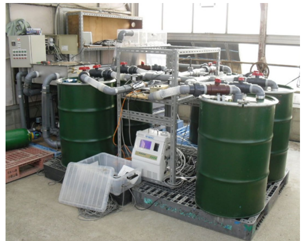
図2 CO 2 回収・施用装置