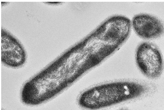
図1 糖化菌の電子顕微鏡写真

食品・農業生産により副次的に生じる膨大な量の農業残渣は、自然界での分解が難しく、未利用のまま放置・廃棄・焼却によってGHGの発生源となっている。「微生物糖化法」(図2)は酵素を一切使わず、微生物のみで農業残渣を糖化・可溶化できる新しい糖化法である。その「微生物糖化法」により、固体である農業残渣は分解・液化され、糖質や有機酸となり、バイオガスやバイオ水素へ効率的に変換することができる。さらに、微生物糖化で発生するCO 2 とバイオ水素をメタン発酵槽へ戻し、メタン発酵プロセスを組み合わせたバイオメタネーションを行うことで、未利用の農業残渣からのエネルギー生産や再資源化、加工過程でのGHGゼロエミッション化が可能となる。