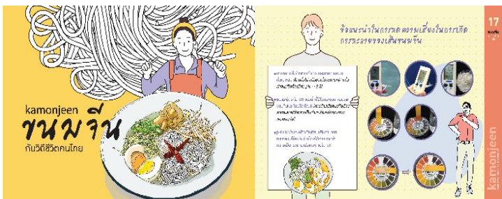
図3 液状化の抑制方法等をタイ語で紹介する小冊子