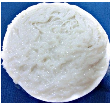
図1 販売前に液状化が発生し、市場から回収された発酵型米麺

発酵型米麺の液状化抑制技術に加え、製法や調理法を現地語で平易に解説するタイ語の小冊子(図3)は、製麺業者の収益向上、食品ロスの軽減、食育の推進に利用されている。