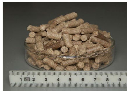
図4 「JES1」を原料とするペレット燃料