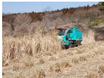
図2 飼料用収穫機での収穫