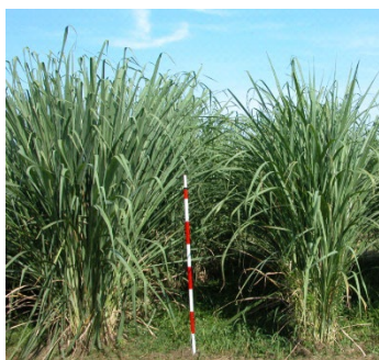
図1 エリアンサス品種「JES1」の草姿(熊本県合志市)

背景・効果・留意点 アジア地域に広く自生する多年生イネ科植物エリアンサス( Erianthus arundinaceus )は、バイオマス生産性が高く、永年栽培が可能であることから、新規バイオマス作物として利用できる。日本において、世界初のバイオマス生産用エリアンサス品種「JES1」(図1)を育成した。 この「JES1」は、株出し栽培により一旦植え付ければ5年以上続けて栽培が可能であり、日本の関東地域(北緯37°)以南において5年間の平均で年間20t/ha以上の乾物収量が得られる(図2、3)。また、栃木県さくら市では実用栽培が行われており、収穫物と木質バイオマスを50%ずつ混合したペレットが生産され、ボイラー燃料として使用されている(図4)。 同様なエリアンサスの育種やペレット利用は、バイオマス作物の利用を検討している他のアジア地域にも適用できる。