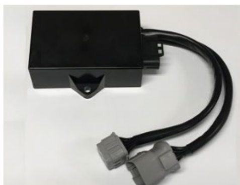
図3 市販を開始した汎用ECU