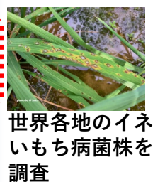
世界各地のイネいもち病菌株を調査