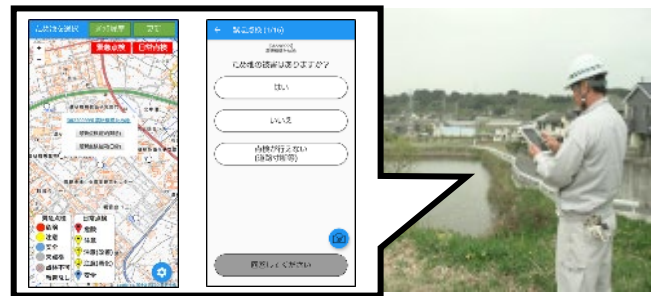
図2 ため池管理アプリ