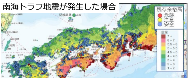
地震発生時の危険度予測

「ため池防災支援システム」(図1)では、大災害時に決壊危険度をリアルタイムで予測するとともに、現地の被災状況および被災写真を国や自治体等の防災関係者と情報共有できる(図2)。その結果、迅速な緊急対策や災害支援を達成することができる。