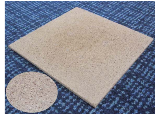
図 1 幹粉末を原料としたバインダーレスパーティクルボード（円内は表面の拡大）