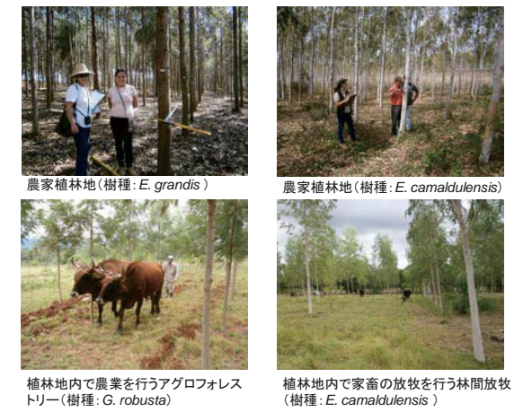
図 2 植林 CDM 事業の概要