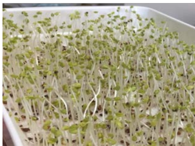
図2 微酸性電解水を用いて栽培したブロッコリースプラウト Fig. 2. Broccoli sprouts cultivated with slightly acidic electrolyzed water

異なるアルファベットは5%水準で有意差がある。 Fig. 1. Sulforaphane content (A) and myrosinase activity (B) of broccoli sprouts treated with different available chlorine concentrations of slightly acidic electrolyzed water. Different letters mean statistically significant difference (P<0.05).