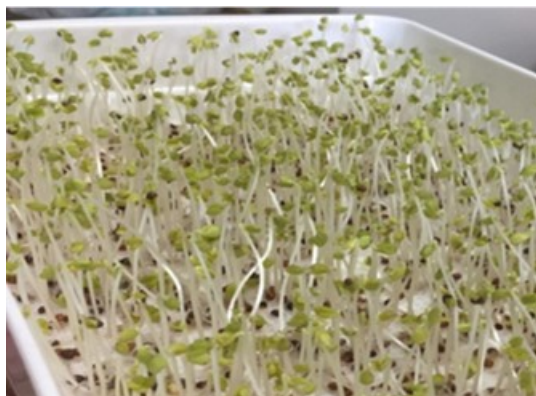
図 2 微酸性電解水を用いて栽培したブロッコリースプラウト

微酸性電解水の各数字は有効塩素濃度 (ppm) を示す。栽培 8 日後の試料の値を示した。両者ともに有効塩素濃度 40 ppm の場合が最も値が高い。異なるアルファベットは 5%水準で有意差がある。