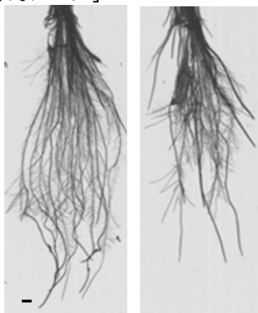
IR64に PSTOL1 を 導入した系統 (準同質遺伝子系統) IR64